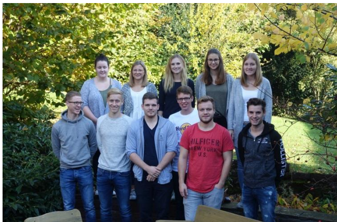
Die Teilnehmer des Großhändlerkurses FG10 vom 16. bis 20.10.2017 in Goslar.

„Ein Großteil von uns jungen Erwachsenen ist bereits am Vorabend angereist, wir alle waren von der fantastischen Atmosphäre begeistert und haben unter diesen Umständen schnell zueinander gefunden. Es hat keinen ganzen Tag gedauert bis wir uns einig waren, dass diese Art und Weise des Miteinanders ganz nach unserem Geschmack ist und wir eine unterhaltsame sowie fördernde Woche mit unseren Dozenten erleben werden.“