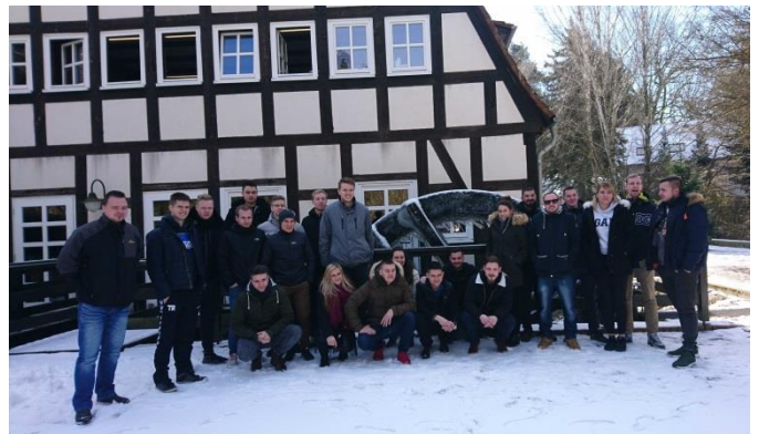
Die angehenden Groß- und Außenhändler des Intensivtrainings vom 19. bis 23.03.2018 in Bad Belzig.

Danke für die tolle Lernwoche und das angenehme Lernklima. Man kann sich keine bessere Prüfungsvorbereitung vorstellen. An beide Dozentinnen und das ganze Hotelteam: ein großes Lob und DANKE!“