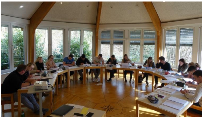
Die Teilnehmer des Großhändlerkurses FG03 vom 05. bis 09.03.2018 in Goslar.

Zusammenfassend lässt sich sagen, dass die Seminarwoche ein voller Erfolg war und wir sehr gut auf die Abschlussprüfung vorbereitet wurden.“