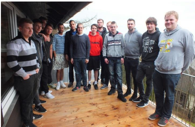
Die Azubis des Kombikurses vom 29.02. bis 04.03.2016 in Goslar.

Auch die Lagerlogistiker kamen im Frühjahr nicht zu kurz. Im Februar und März wurde jeweils eine Prüfungsvorbereitungskurs für Fachkräfte für Lagerlogistik und Fachlageristen durchgeführt.