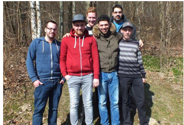
Die angehenden Fachkräfte für Lagerlogistik des Kurses vom 14.03. bis 18.03.2016 in Goslar.

Die Zimmer waren übersichtlich, es war jedoch alles vor Ort. Das Essen war sensationell für uns, es gab von allem etwas und man wurde immer satt. Im Großen und Ganzen war es hier top!"